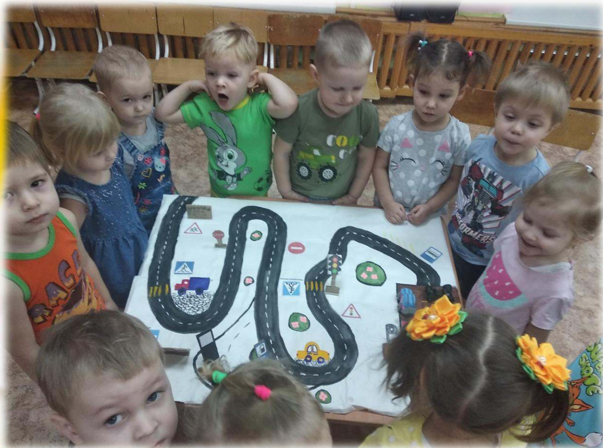
Технология «Скрайбинг» в познавательном развитии