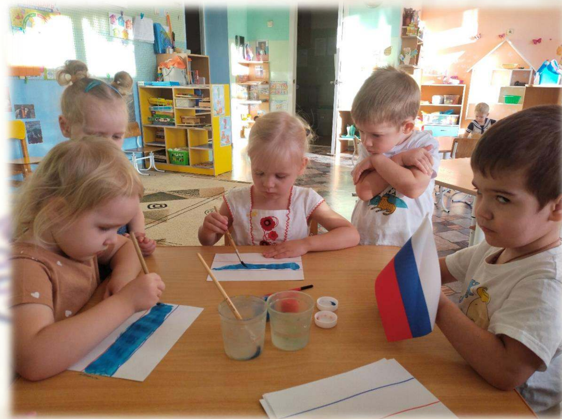
Технология «Скрайбинг» в изобразительной деятельности