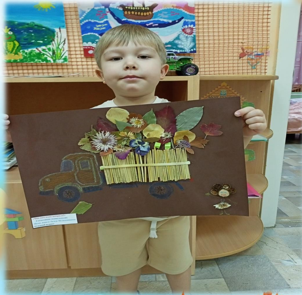
«Тепло и уютно в букете» Создано в рамках проекта «Мир детства» в Детском Музее Минской области